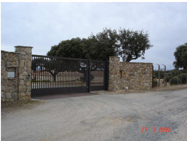
Entrada a la finca. La puerta tiene portero automático con al menos 11 direcciones.