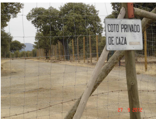
Vallado de la finca con cartel de coto privado de caza.