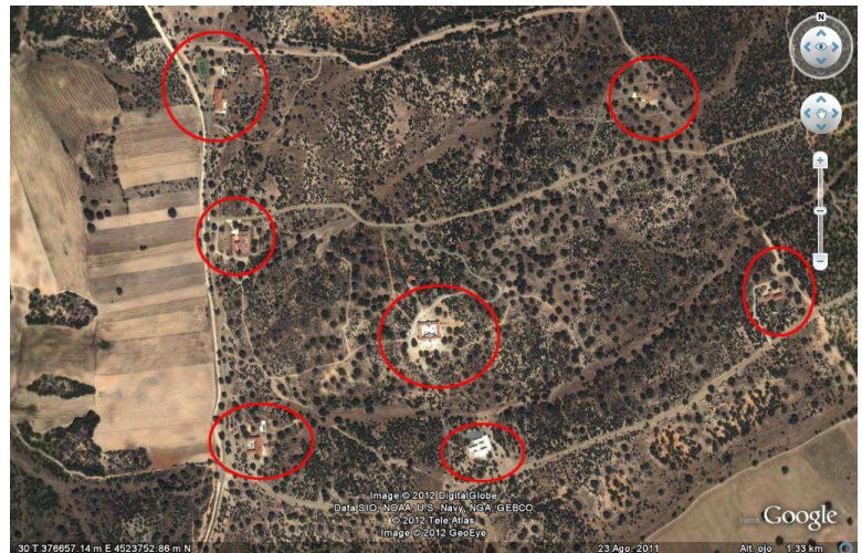
Situación de la finca de viviendas de lujo en Muñopedro (Segovia). Ubicación de las viviendas en la finca. Se aprecian los viales de acceso que han tenido que abrirse. Algunas tienen piscina y pista deportiva anexa.