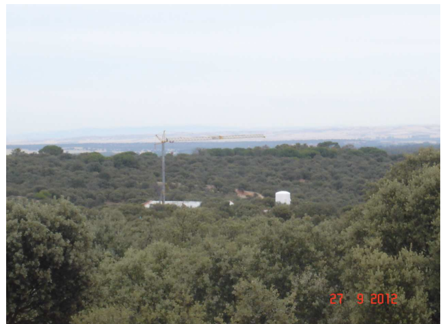
Una de las viviendas con una grúa. En septiembre no se apreciaba actividad, por lo que puede pensarse que la crisis también afecta a este tipo de viviendas.