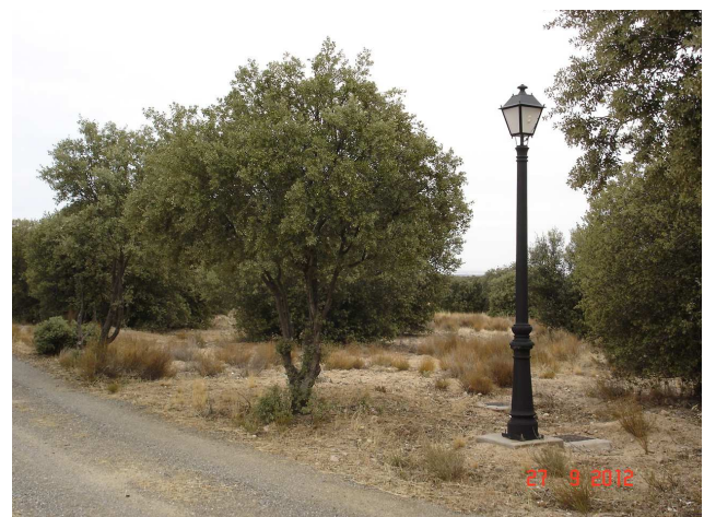
Vial abierto dentro de la finca, jalonado de farolas.