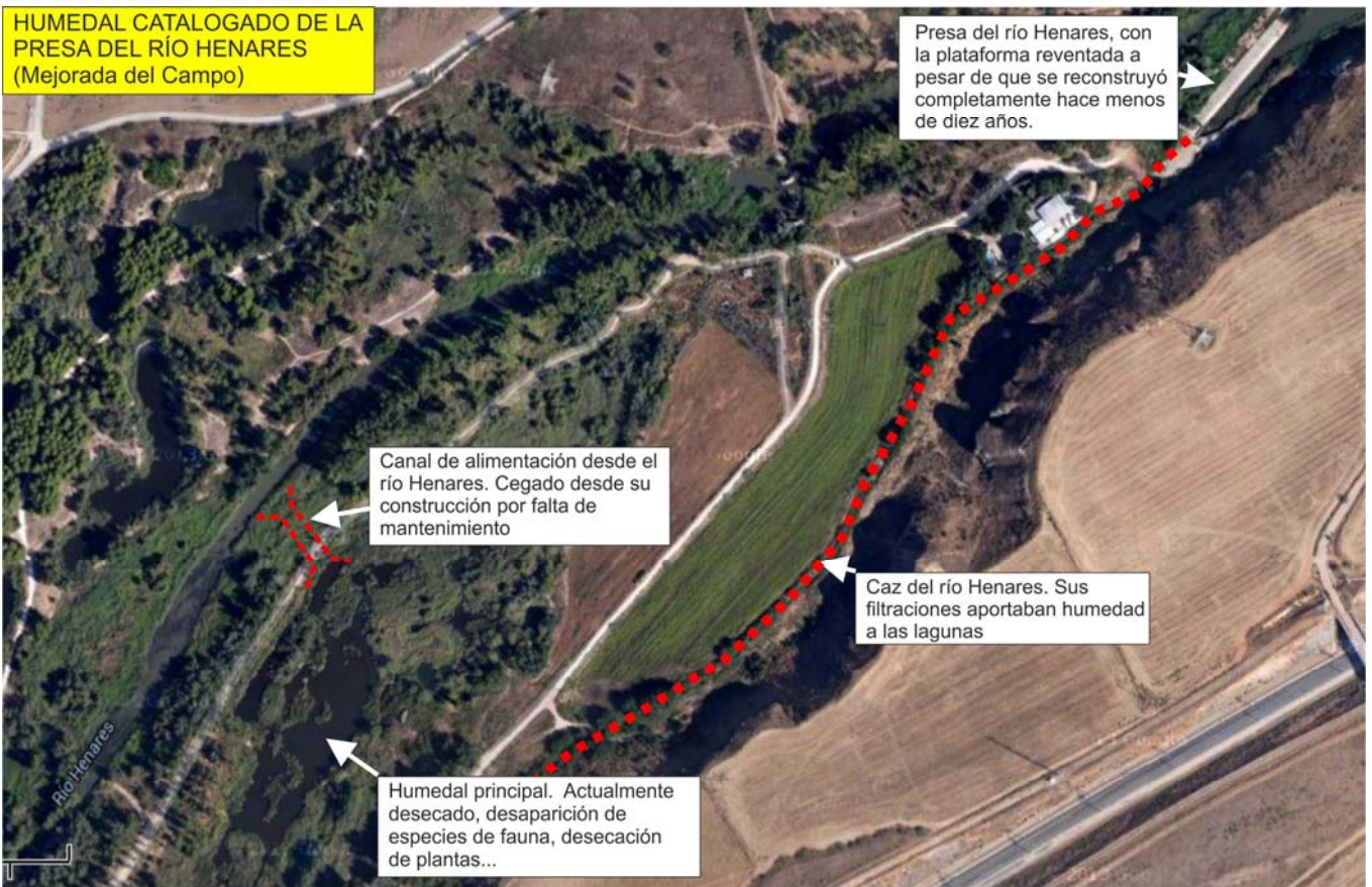
Croquis general del humedal de la Presa del río Henares.

Septiembre de 2013. Dos meses después del acto institucional el humedal está seco. Este humedal nunca se había desecado en más de veinte años de su existencia. Esta situación es consecuencia de la mala planificación en algunas obras y del desinterés institucional por el estado de estos ecosistemas.