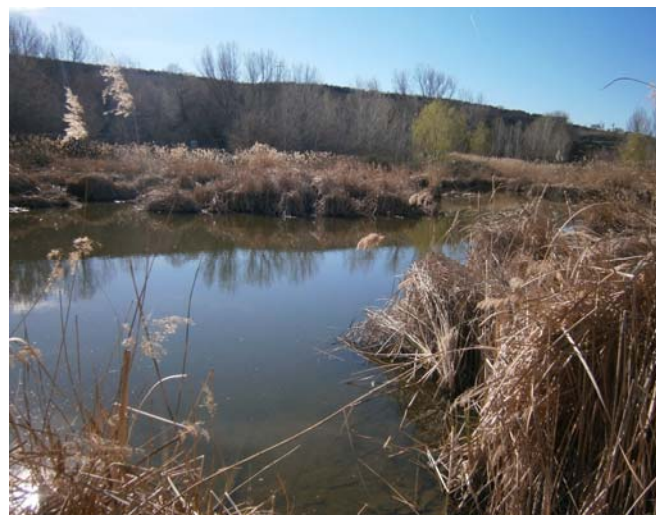
La laguna principal en marzo de este año, antes de la visita del Consejero de Medio Ambiente.