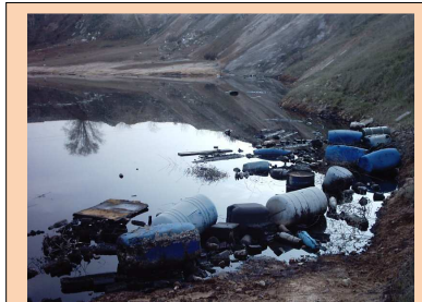
Laguna de aceite tóxico de Arganda del Rey

Desde los años 60 Esperilla, para empresa ULIBARRI-ambientales y convertido en una años mueren al de Madrid adquirió propiedad de recuperación de la tareas de extracción que la Consejería de Medio Ambiente asegura que supondrán 14,5 millones de euros.