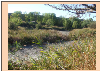
Humedal desecado de Las Islillas. (Mejorada del Campo).

Parque Regional del Catálogo de Madrid. Es un recinto se ha rehabilitación, el 2013. Al finalizar de propaganda del desecado gran parte de la Consejería de Medio Ambiente se ha desentendido de la conservación de este espacio.