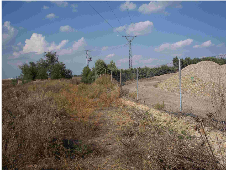
Vallado de la explotación ocupando posiblemente el dominio público hidráulico.