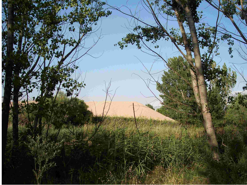
Acopio de materiales en la parte más al sur de la finca, ocupando la ribera del Jarama