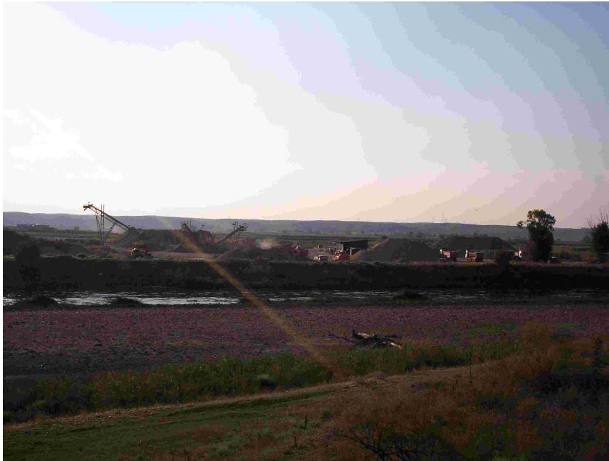
Explotación vista desde la orilla opuesta del Jarama. Se observa cómo la gravera ha eliminado por completo el bosque de ribera.