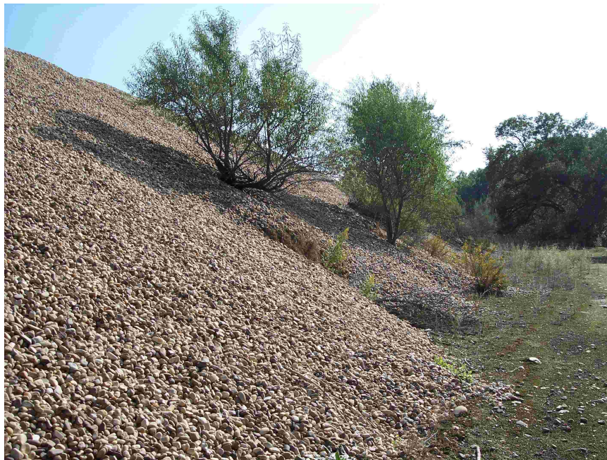
Acumulación de gravas en el bosque de ribera (Izquierda). Acumulación de gravas en la ribera (abajo a la izquierda). Planta de tratamiento (Abajo a la derecha).